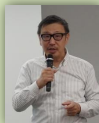
若林 靖永さん 京都大学経営管理大学院 院長 京都大学教授

詳しくは東京都生協連 HP https://www.coop-toren.or.jp/ まちづくりニュース vo.9 をご覧ください。